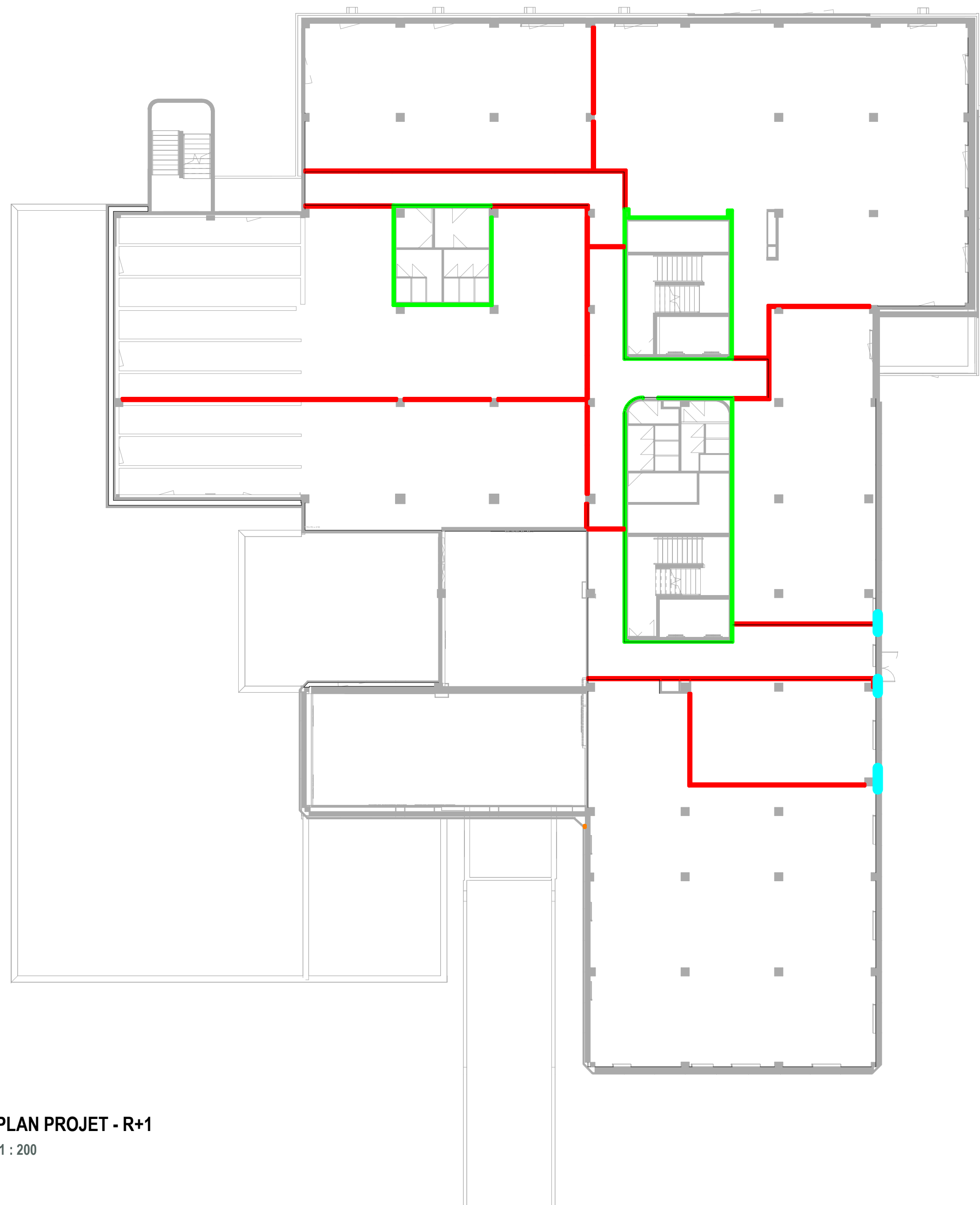
PLAN PROJET - R+1 1 : 200