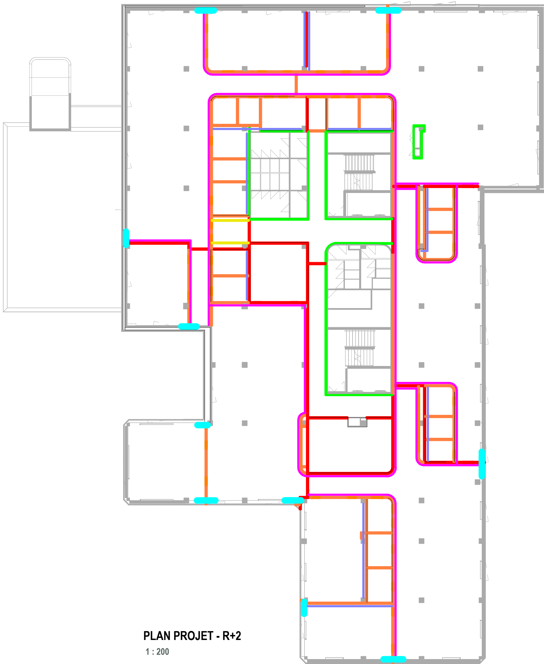
PLAN PROJET - R+2 1 : 200