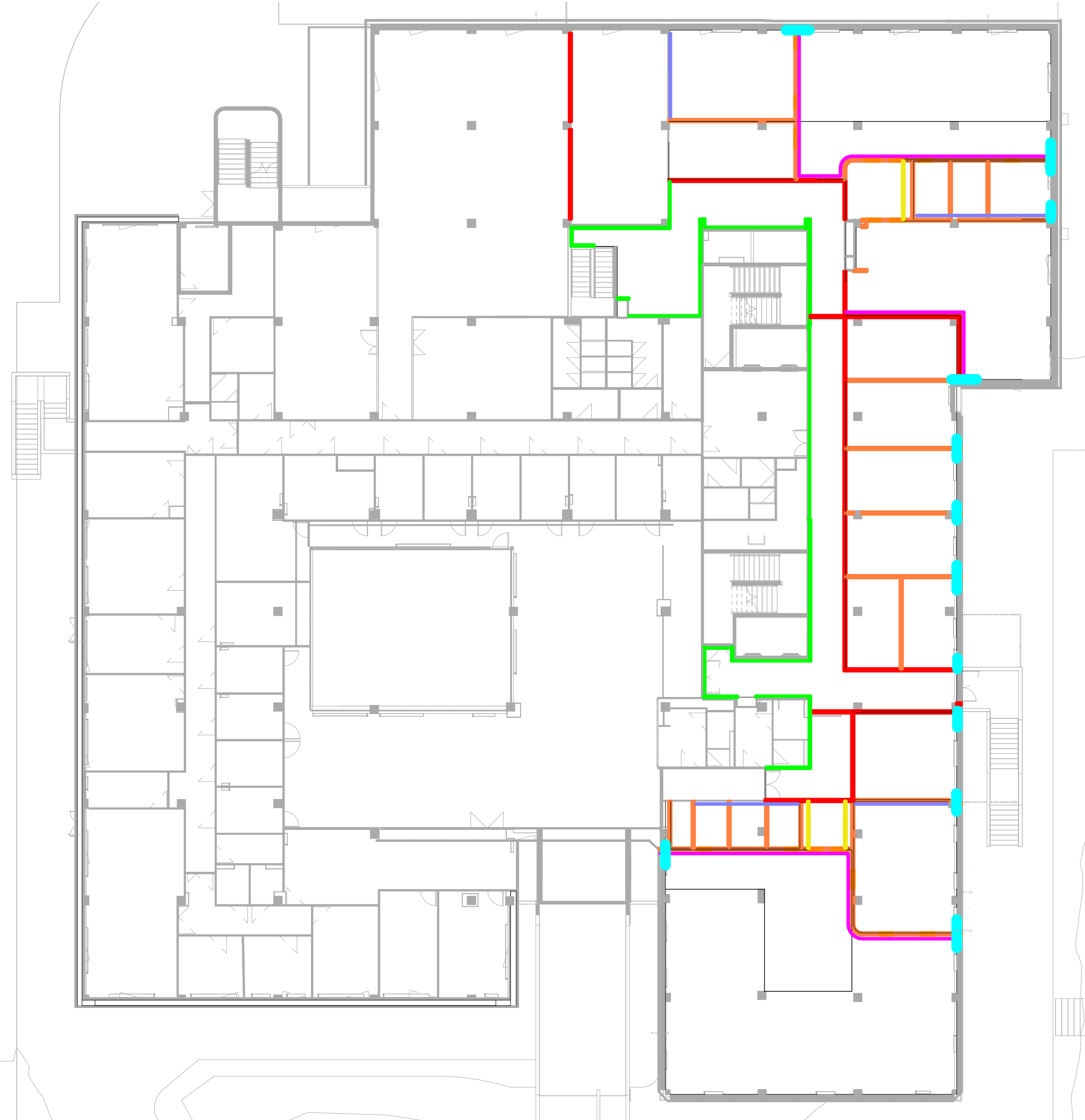
PLAN PROJET - RDC SUPERIEUR 1 : 200