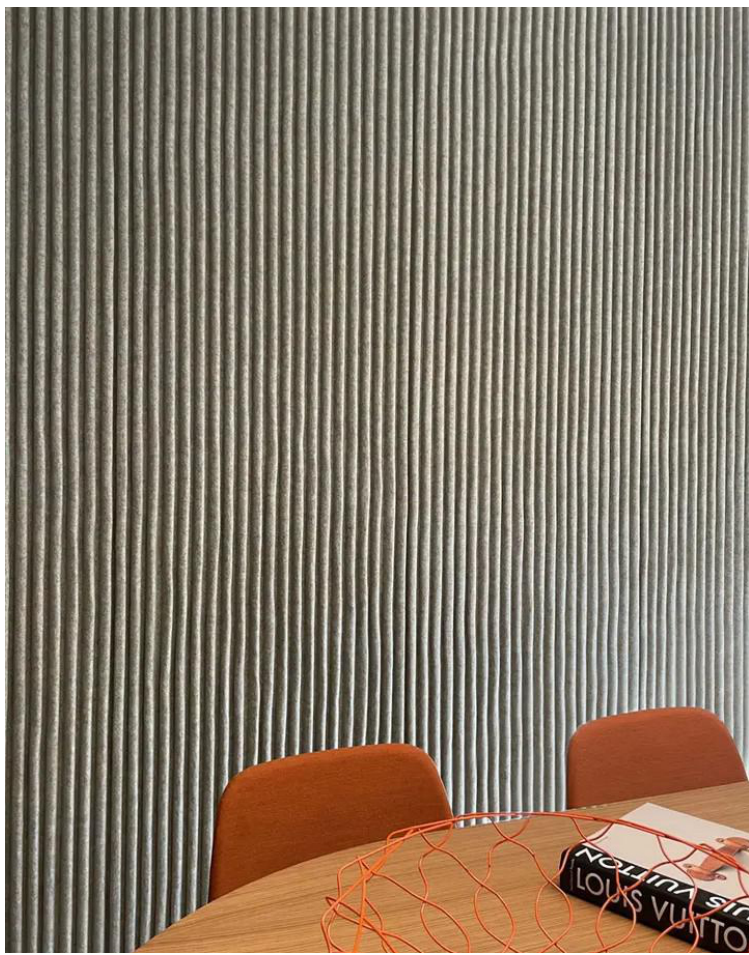
M4 REJETEMENT MURAL ACOUSTIQUE FEUTRE TYPE TUNEL DE SLALOM

Maître d'ouvrage : CAISSE PRIMAIRE D'ASSURANCE MALADIE 35 Rue descartes - 62100 CALAIS